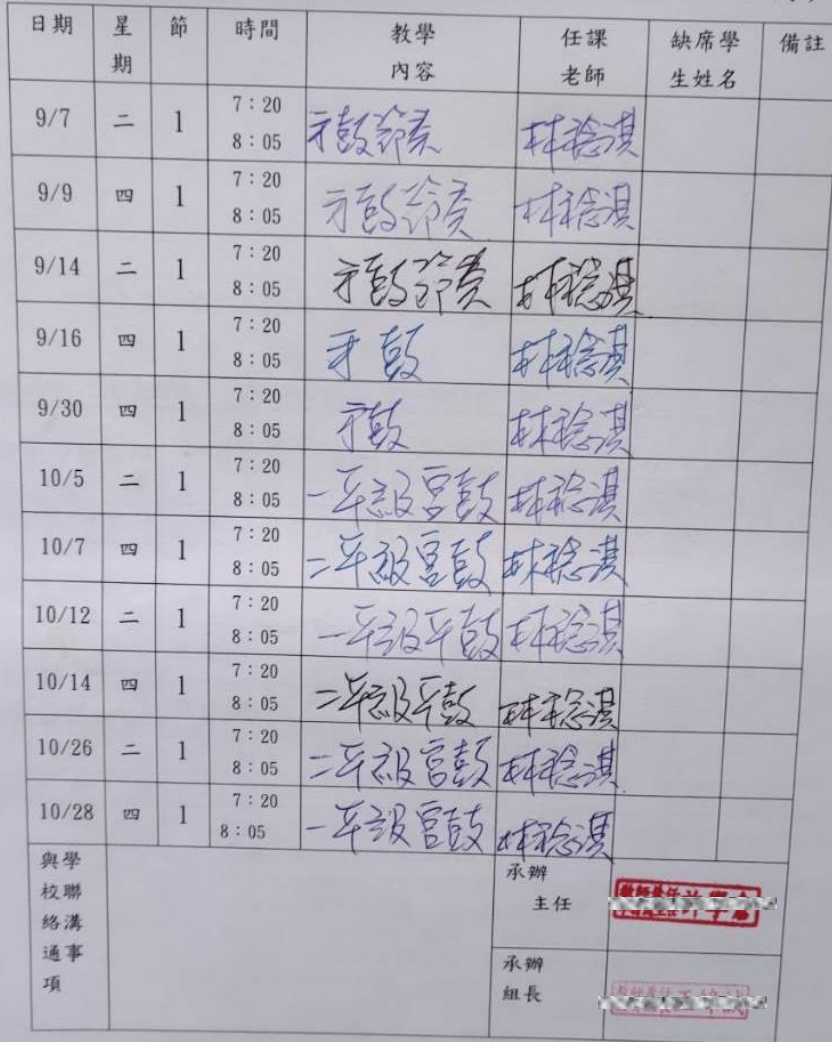
南投縣立新國中 110 年-太鼓-教學日誌( 9-10 月)